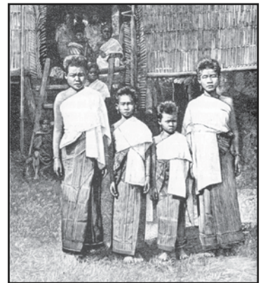
ຮູບແຕ້ມນີ້ແມ່ນຮູບຂອງແມ່ຍິງ ລາວ 4 ຄົນ ໃນປະມານປີ 1890.

ປະເທດລາວໃໝ່ ຖືກຕັ້ງຂຶ້ນໃນກາງສະຕະວັດທີ 14 ໂດຍ ເຈົ້າຜ້າງຸ່ມ. ອານາຈັກຂອງພະອົງຖືກເອີ້ນວ່າ ລ້ານຊ້າງ ແລະ ມັນກວມເອົາດິນແດນ ຂອງລາວທັງໝົດໃນປະຈຸບັນ ແລະ ຍັງກວມເອົາຫຼາຍສ່ວນຂອງພາກ ເໜືອ ແລະ ພາກຕາເວັນອອກຂອງໄທ. ໃນປີ 1373 ລູກຊາຍຂອງພະອົງ